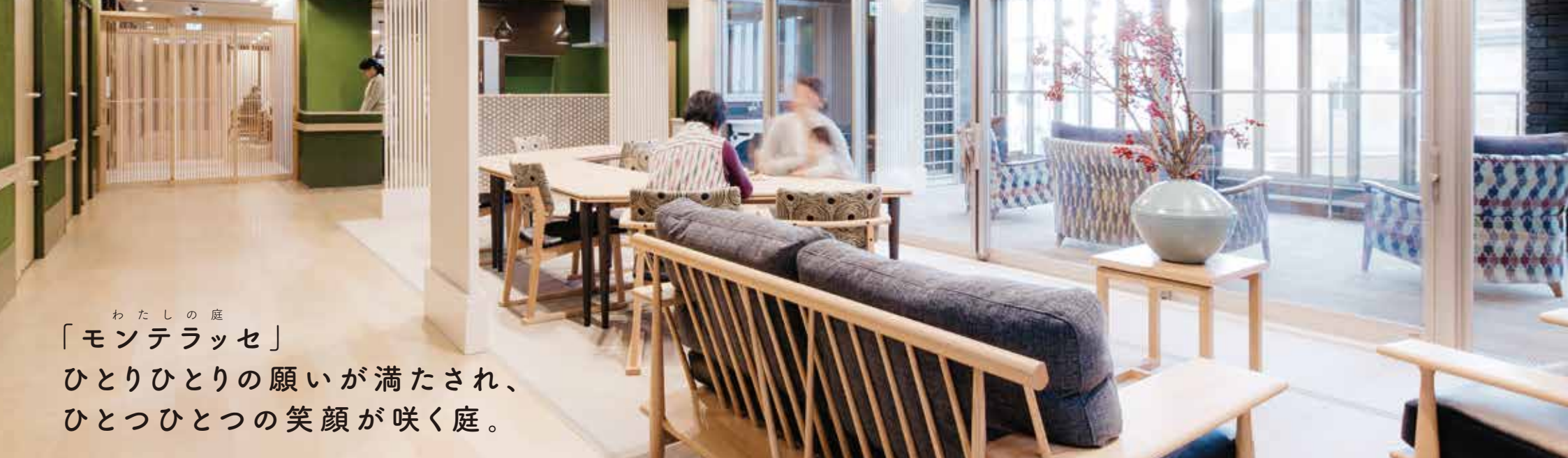
リビングとサンルーム

わたしの庭 「モンテラッセ」 ひとりひとりの願いが満たされ、 ひとつひとつの笑顔が咲く庭。